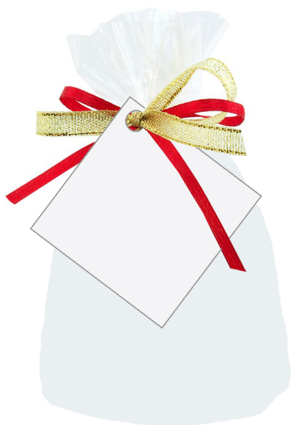
Бирка на свечи